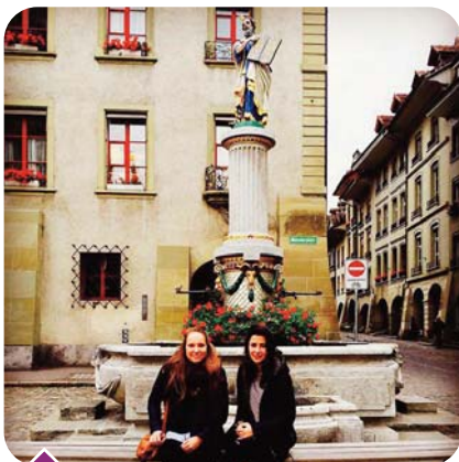
... à Berne...