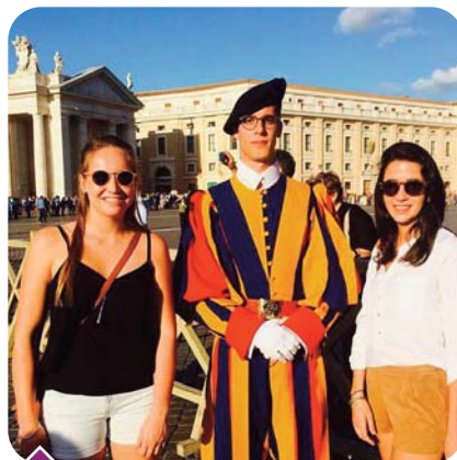
... encadrant un garde suisse du Vatican