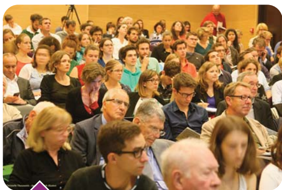
Salle comble pour #ClimAcop21

Propos recueillis par Christelle Thouvenin